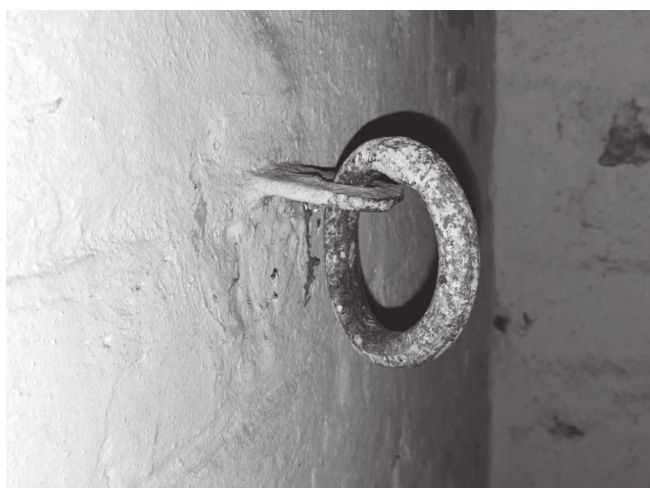
KÓŁKO DO PODWIESZANIA WIĘŹNIÓW ZA RĘCE W CELI FORTU III POMIECHÓWEK