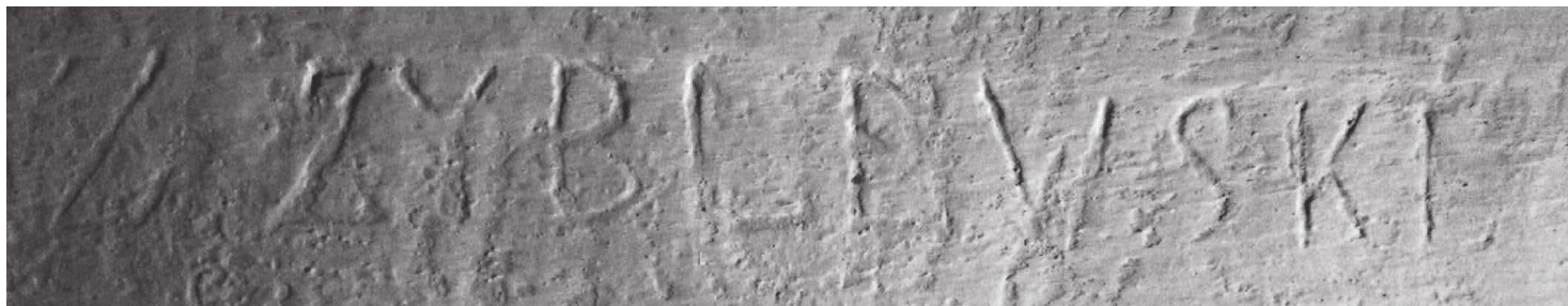
PODPIS ZYGMUNTA ZYBLEWSKIEGO

2. POPATRZ NA FOTOGRAFIE I PRZYPOMNIJ SOBIE OBRAZY Z FILMU. CZY WIESZ, CO PRZEDSTAWIAJĄ TE ZDJĘCIA?